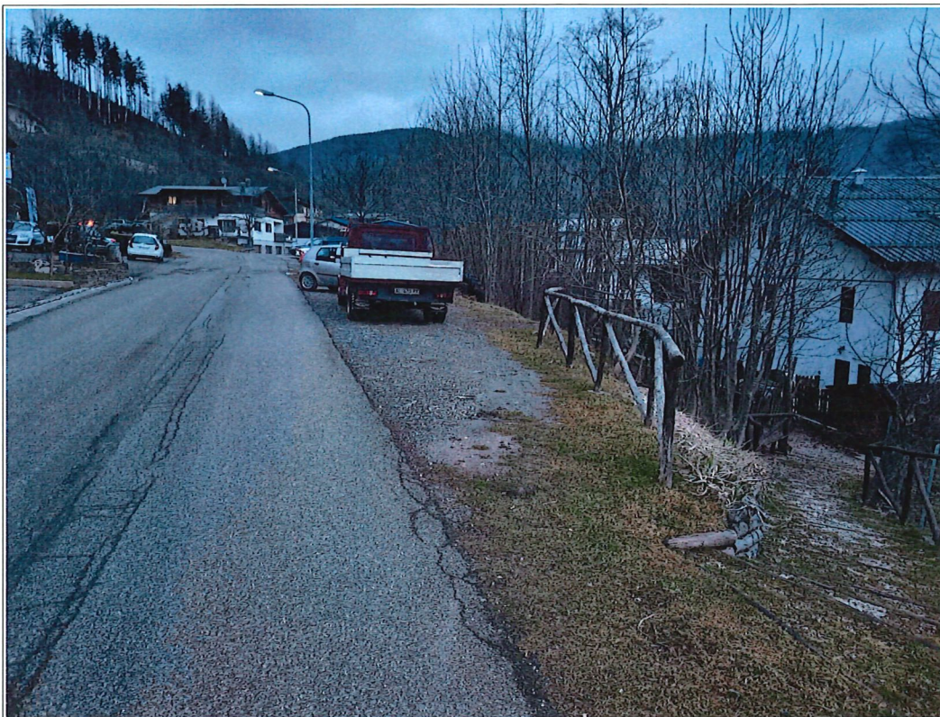
Documentazione fotografica dell'area lato strada, particella F.14 Mappale 635